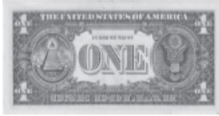
Şekil-1: 1 Dolar

biliyordu. Paralel işadamları, askerler, Boğaz'daki aşiret ve Beyaz Türkler... Paralel işadamları, "Biri ... komutanlar sattı" diyor. Zincirde bir kopuş gerçekleşti ve girişim başarısız oldu. İkinci adımı kimse bilmiyor. Bir de herkese gönderilen şifreli dolarlar var!" 2