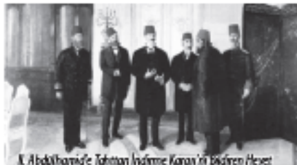
K. Abdülhamid'e Tahttan İndirme Kararı'nı Bildiren Heyet

"Manıyazade Refik Bey: Orada (Macedonia Risorta ve Labor et lux localarında) Masonlar olarak toplanıyorduk, çoğumuz da masonduk, fakat aslında örgütlenmek için toplanıyorduk. Bunun yanı sıra yoldaşlarımızın büyük bir bölümünü, üyelerini ince eleştirip sık dokuyarak seçmeleri nedeniyle Cemiyetimiz için bir elektif görevi gören bu localardan