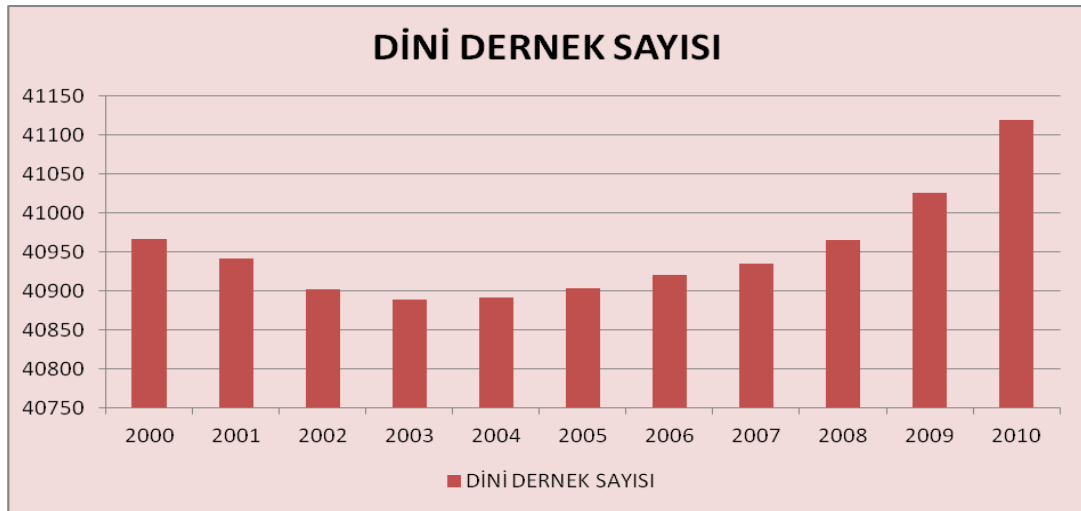
Şekil 2: Türkiye'de Dini Dernek Sayıları (2000-2010)

• Bayrampaşa Altıntepsi Mahallesi'ndeki sağlık ocağı arazisine cami inşaatına başlanmasını" (Milliyet 1997). örnek olarak verilebilir.