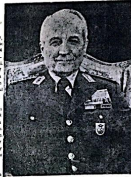
Konya Cumhuriyet Kurumu Başkanı Orgeneral K. İsmail EREN

İlimizde 147 merkeze sürdürülen tohumluk çalışmaları kapsamında 60 bin ton tohumluk üretilmiştir. Üretilen tohumluklar, ilçe merkezindeki tohumluk fabrikalarına gönderilmiştir. Üretilen tohumluklar, ilçe merkezindeki tohumluk fabrikalarına gönderilmiştir.